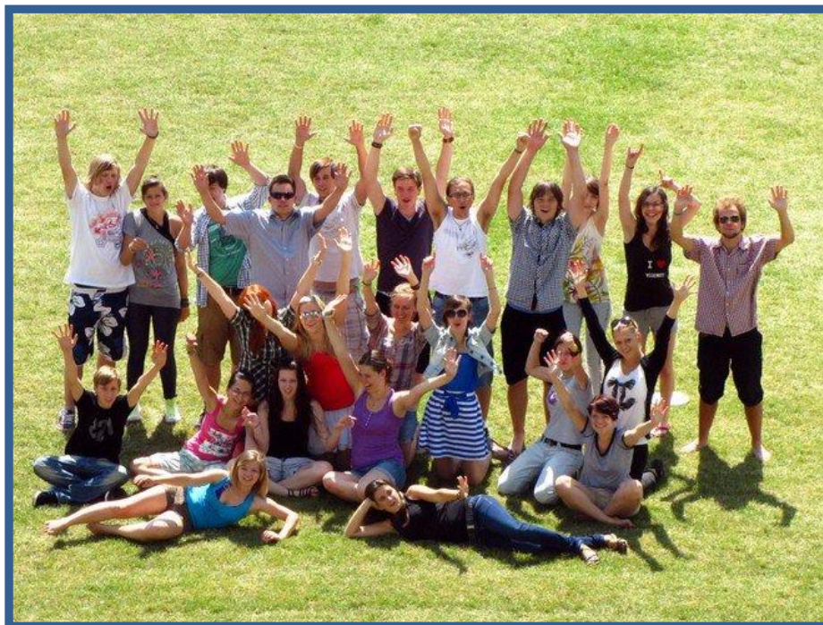
(Setkání – Portal of Good News)