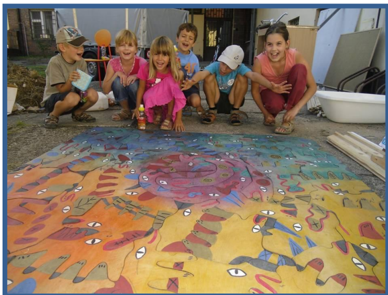
(Stěhování – práce i zábava)

Přesto však každodenní činnost a budoucnost rodinného centra zatěžuje vysoký nájem a plánovaná privatizace budovy polikliniky. Proto otazníky v nadpisu této kapitoly jsou a budou ještě dlouho aktuální.