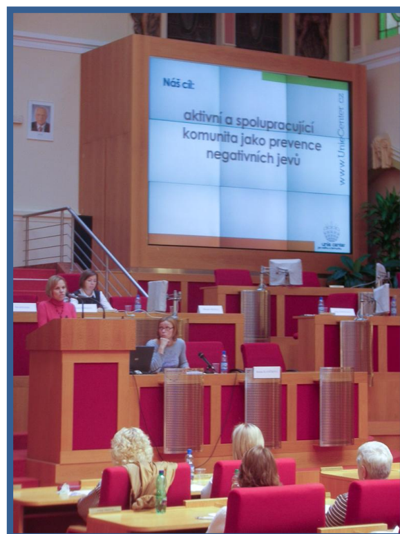
(Konference Praha rodinná)

V květnu jsme se zúčastnili dalšího KULATÉHO STOLU NA MAGISTRÁTU HLAVNÍHO MĚSTA PRAHY , který byl tentokrát spoluorganizován se Sítí mateřských center.