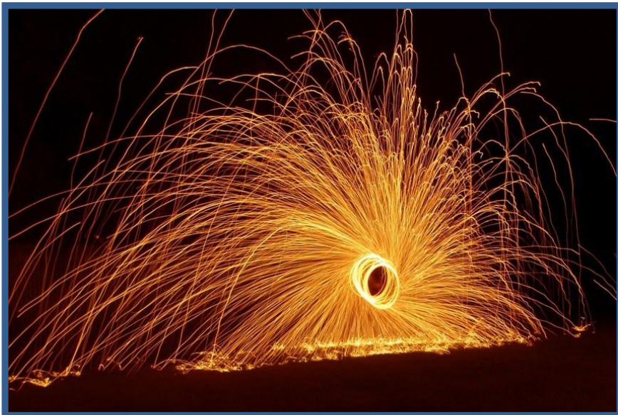
(Lampiónový průvod – vystoupení kurzu Pokustónů)

Také se těšíme, že rozšíříme své možnosti v poskytování pro-sociálních služeb v rámci projektu Přes Překážky. V tomto směru se snažíme o registraci sociálně právní ochrany, která nám v mnohých ohledech umožní vyjít vstříc jak přímým zájemcům o projekt, tak i potřebným rodinám.