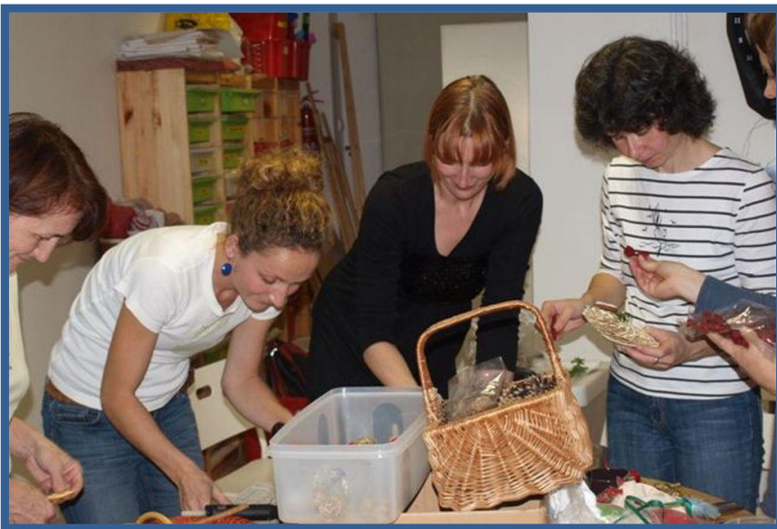
(Setkání dobrovolníků – tvořivá dílna)