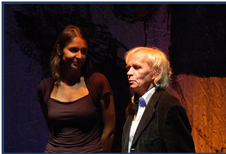
(Znovuotevření Divadla Jiřího Srnce)

Říjen - prosinec 2011 – Příprava žádosti o vydání pověření k výkonu sociálně právní ochrany dětí. Sběr informací a podkladů k činnostem rodinného centra, pro které se pověření vydává.