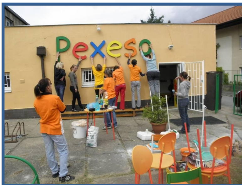
(Stěhování do nových prostor)