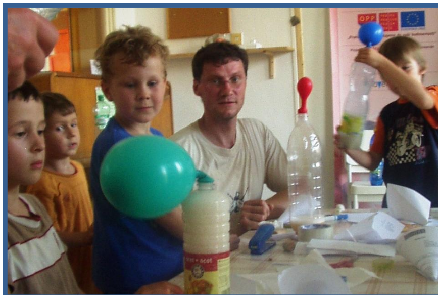
(Kurz - Pokustóni)

V rámci klubu se narázově konaly například tyto akce: Atletická odpoledne, Zumba pro školáky, Turnaj v šipkách. Za zmínku stojí také natáčení TV Metropol během workshopu o zdravé výživě "Jez zdravě a máš to navždy v postavě i v hlavě". TV Metropol se pak do Pexesa vrátila ještě jednou, tentokrát na kurz pro rodiče s dětmi, a připravila reportáž o masáži miminek. Lektorka kurzu pak byla hostem prosincového vysílání.